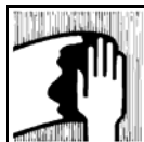
Gebruik industrieel papier of schone doekjes